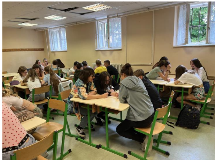
Értékelő óra – témanap, vetélkedő