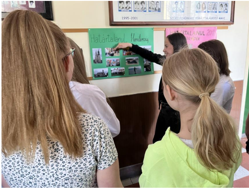
A kiállítás „megnyitója”