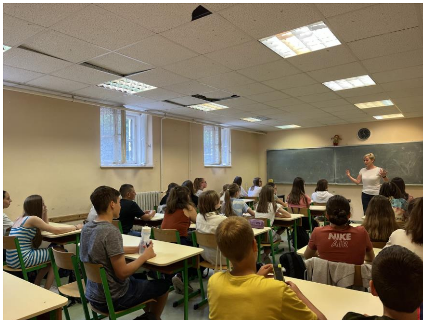
Értékelő óra - témanap

A témanap zárásaként az előre kinyomtatott fényképekből posztereket és kiállítást készítettünk, amit az iskola egyik folyosóján meg is nyitottunk, így az összes diák megnézhetette, hogy merre is jártunk.