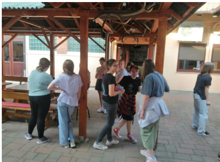
Csúza – a szállás udvara