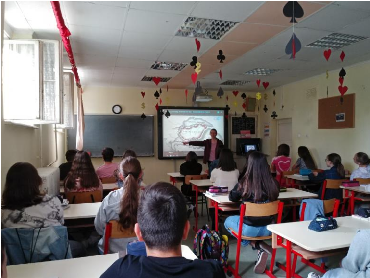
Értékelő óra - témanap