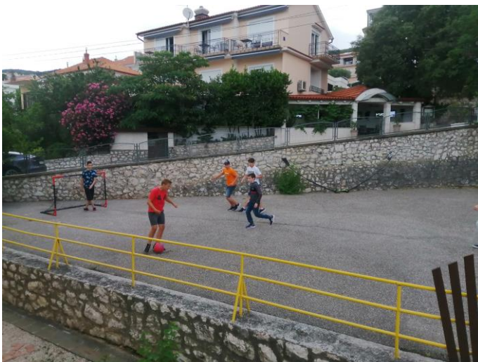
Crikvenica – a szállás udvara