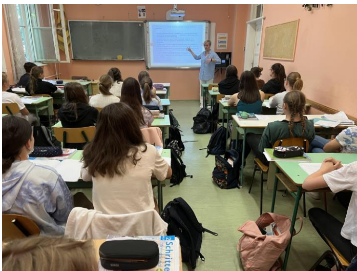
Előkészítő osztályfőnöki óra