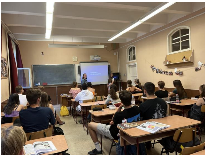
Élménybeszámoló a 11. B-nél